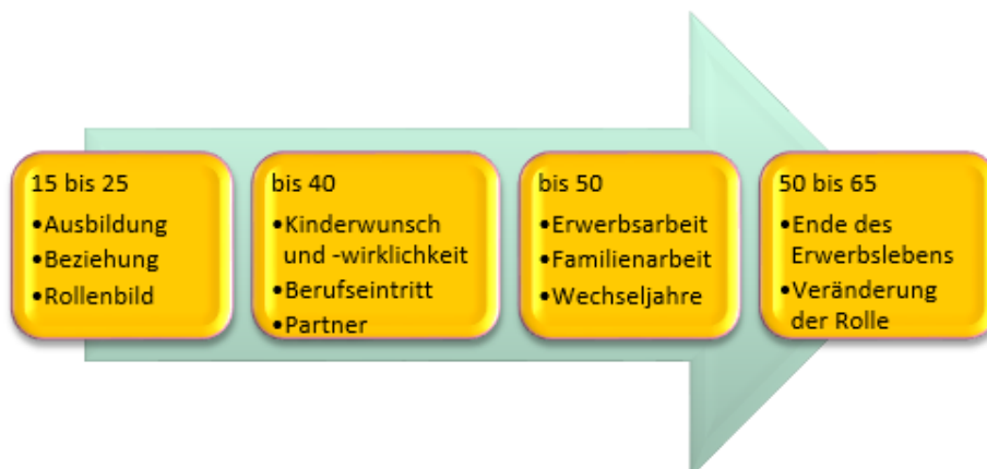
Abbildung 1: Entwicklungsaufgaben für Frauen in der Phase „Erwerbsleben“