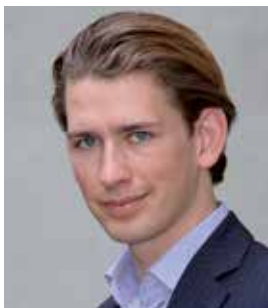
Sebastian Kurz Staatssekretär für Integration